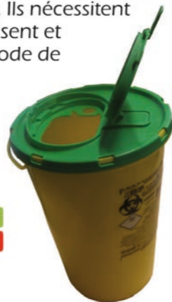
Collecteur à DASRI distribué en pharmacie pour les personnes en auto-traitement