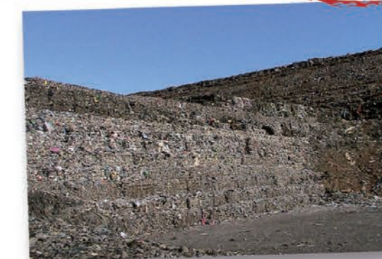
En 2013, 51% de nos déchets ont été enfouis...

51% des déchets collectés sont enfouis soit 281.2 kg/hab