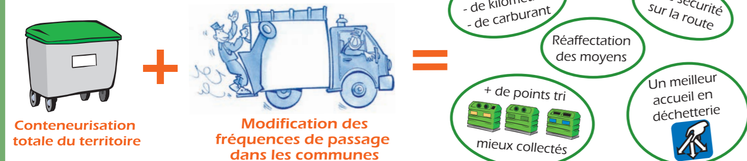
Schéma du nouveau dispositif de collecte